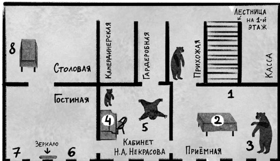
СХЕМА МАРШРУТА, 2-й ЭТАЖ